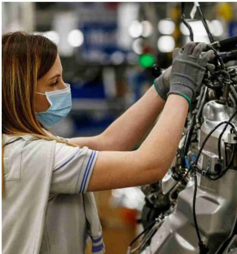
Una lavoratrice metalmeccanica: gli operai specializzati sono una figura ricercata

UN PUZZLE DA COMPORRE Tra domanda e offerta il gap tocca il 50% Gli stipendi bassi in alcuni settori non spiegano tutto