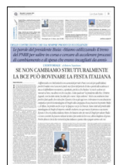
Illustrazione di Giulio Poggesi

Superbonus: 18,5 miliardi - l'importo che ricadrà nel Mezzogiorno dipende dai progetti