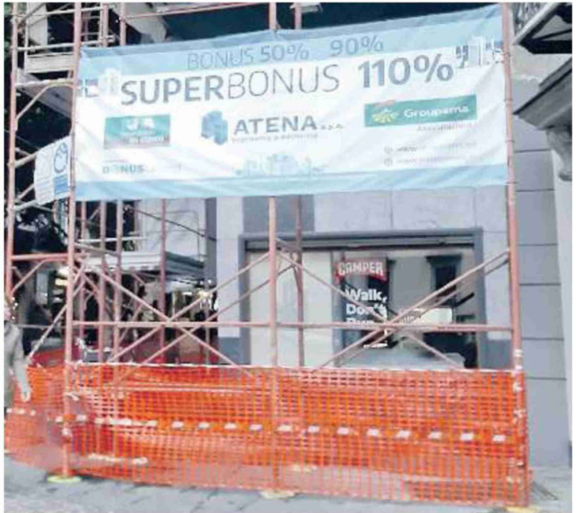
Le nuove restrizioni al Superbonus potrebbero avere un impatto sui cantieri

CRITICHE ANCHE ALLE RESTRIZIONI SULLA CESSIONE DEL CREDITO CHE PESERANNO SU CHI HA MENO LIQUIDITÀ